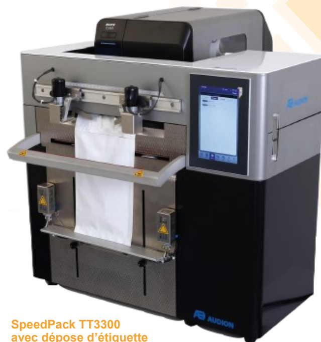
SpeedPack TT3300 avec dépose d'étiquette

Cette machine est particulièrement adaptée pour le conditionnement de petits composants en sachet, pour des petites et moyennes séries de produits.